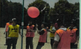
わたぼうし・矢田たんぼぼチーム VS リサイクルたんぼぼ・東住吉たんぼぼチーム でも、勝敗に関係なくみんなで風船バレーを楽しみました♪