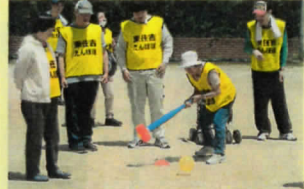
各事業所より代表を決めた後、決勝戦で男女上位3名にはメダルが授与されました！