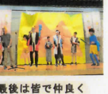
最後は皆で仲良く歌いました♪