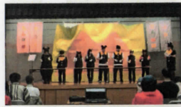
「ミッキーマウスマーチ」を演奏!